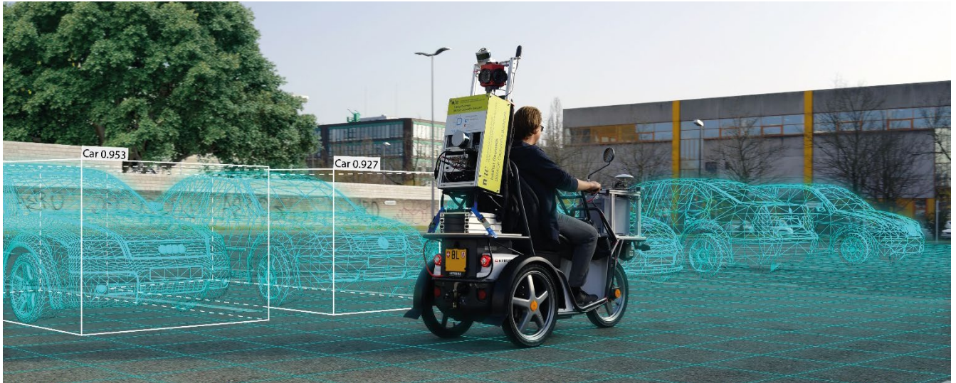
Schematische Darstellung der 3D-Detektion von Fahrzeugen mit dem Mobile Mapping System des Instituts Geomatik